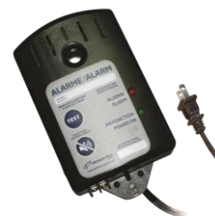
Boîtier d'alarme du poste de pompage

Lorsque l'alarme est déclenchée par un niveau d'eau anormalement élevé, contacter le service après-vente de Premier Tech Aqua afin de solutionner la cause du problème. L'alarme peut être désamorcée en appuyant sur le bouton « SILENCE ».