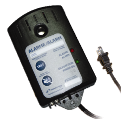
Boîtier d'alarme du poste de pompage

Lorsque l'alarme est déclenchée par un niveau d'eau anormalement élevé, contacter le service après-vente de Premier Tech Aqua afin de solutionner la cause du problème. L'alarme peut être désamorcée en appuyant sur le bouton « SILENCE ».