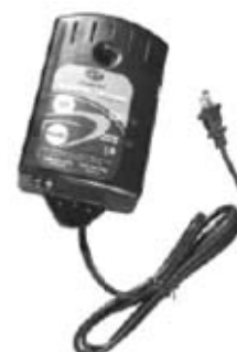
Boîtier d'alarme du poste de pompage

En cas de panne de courant électrique, le système d'alarme continue de fonctionner grâce à une pile de secours alcaline 9 volts (non fournie). L'utilisation d'une pile rechargeable est à proscrire.