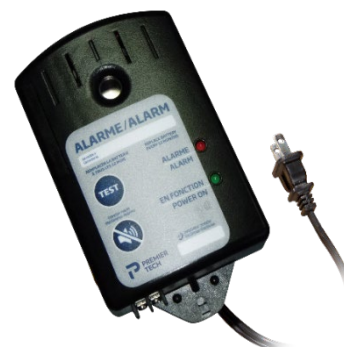
Boîtier d'alarme du poste de pompage