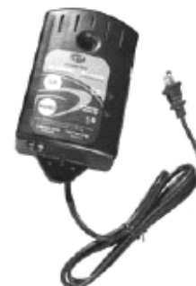
Boîtier d'alarme installé dans la résidence