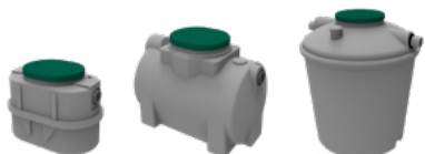
Bacs à graisse, décoloïdeurs