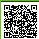
Notice de pose Ecoflo ligne